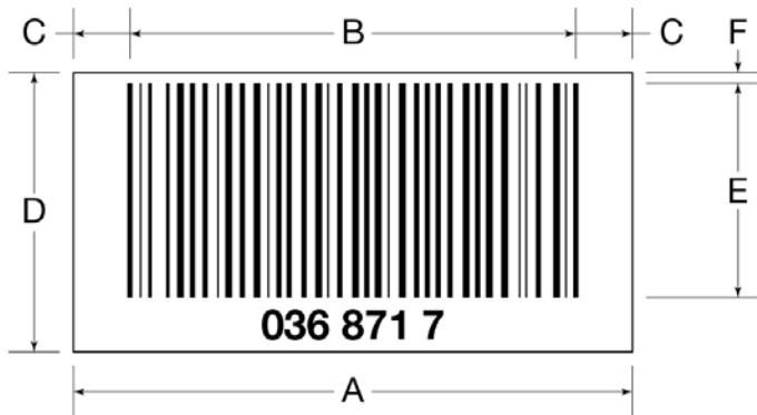
Abbildung 2 Barcode-Abmessungen