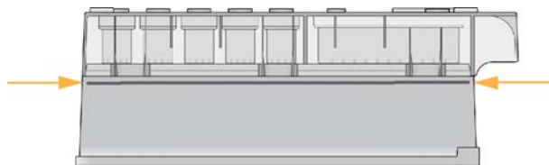
Obrázek 1 Maximální čára ponoru