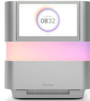
그림 2: NextSeq 1000 및 NextSeq 2000 시퀀싱 시스템 — XLEAP-SBS chemistry를 활용해 간소해진 시퀀싱 워크플로우를 제공하는 NextSeq 1000 및 NextSeq 2000 시스템

NextSeq 1000 및 NextSeq 2000 엑솜 시퀀싱 솔루션은 간소화된 통합 워크플로우를 제공하여 연구자가 생산성을 최대한 높일 수 있도록 해 줍니다. 이 워크플로우는 Illumina DNA Prep with Exome 2.5 Enrichment와 같은 라이브러리 프랩